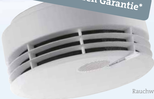
Rauchwarnmelder K GENIUS