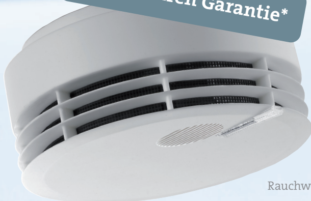
Rauchwarnmelder K GENIUS

* bei Mietgeräten in Kombination mit einem Wartungsvertrag mit KALO