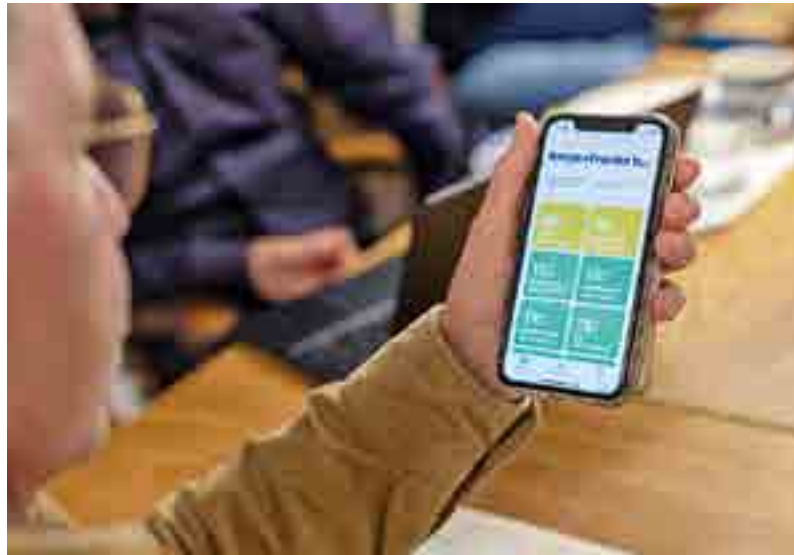
Über die App lassen sich die mit den smarten Thermostaten verbundenen Heizkörper herunterregulieren

Ausgerichtet sind die neu entwickelten, smarten Heizkörperthermostate speziell an den Bedürfnissen der Wohnungswirtschaft: Im Gegensatz zu herkömmlichen Geräten verfügen sie über eine längere Akkulaufzeit, die an die Eichzyklen des Submeterings angepasst ist. Die Thermostate müssen daher sel-