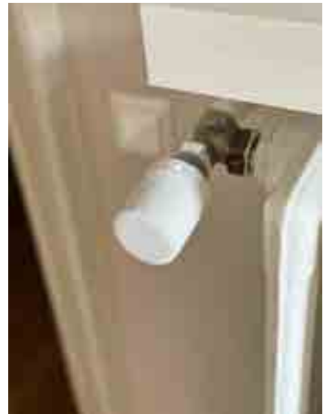
Die smarten Thermostate müssen auf alle Ventilegewinde passen

tener ausgetauscht werden, was sie für Wohnungsunternehmen kosteneffizienter macht. Ein weiterer Vorteil ist, dass die Bewohnerinnen und Bewohner die Thermostate auch ohne App und mit geringem technischen Verständnis nutzen können, was für eine breitere Nutzerakzeptanz sorgt. Die smarten Thermostate können zudem mit der Zentralheizungssteuerung gekoppelt werden, was für zusätzliche Einsparungen sorgt und die Grundlage für einen kontinuierlichen hydraulischen Abgleich schafft. Die Verwaltung von Mieterwechseln und Leerstand wird durch eine zentrale Online-Plattform erleichtert. Darüber hinaus können weitere wohnungswirtschaftliche Prozesse wie die Fernablesung der Heizkostenverteiler über die Funkinfrastruktur angebunden werden. Dies bedeutet für die Wohnungswirtschaft eine höhere Effizienz und Kostenersparnis. —